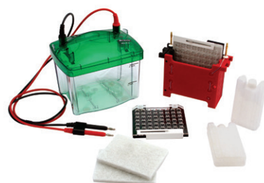
Mini TBC 轉漬槽組 (MP-3030) [可轉漬2片]