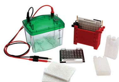
Mini TBC 轉漬槽組 (MP-3030) [可轉漬2片]