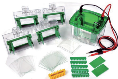
Mini P-4小型垂直電泳 四片膠系統