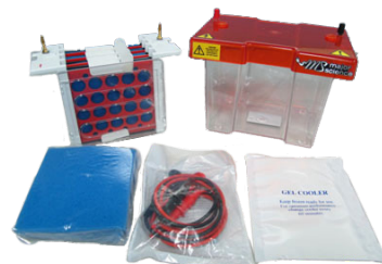
全濕式轉漬槽 (MSB10) [Major science, 可轉漬4片]